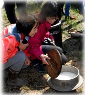
炊きあがりの新米