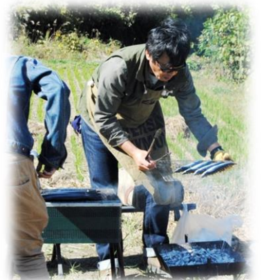
島さんの焼きサンマ