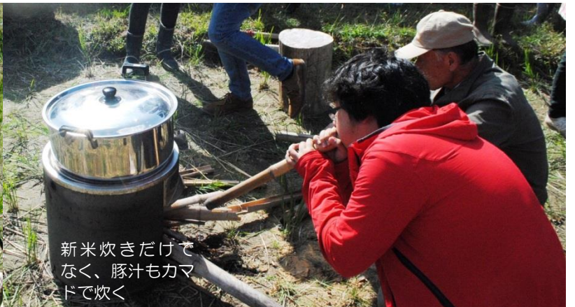
新米炊きだけで なく、豚汁もカマ ドで炊く