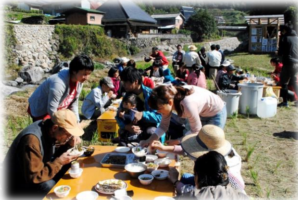
こだわりの材料で作った特製豚汁