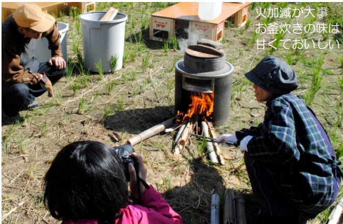
火加減が大事 お釜炊きの味は 甘くておいしい