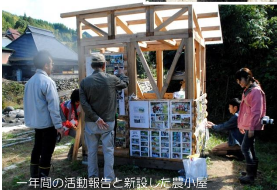
一年間の活動報告と新設した農小屋