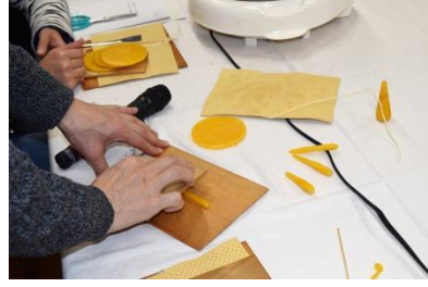
伸ばすときは、板を使う