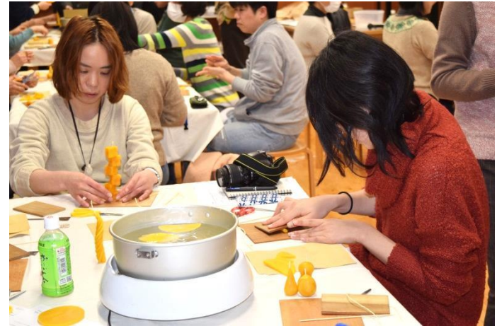
バランスボックス？