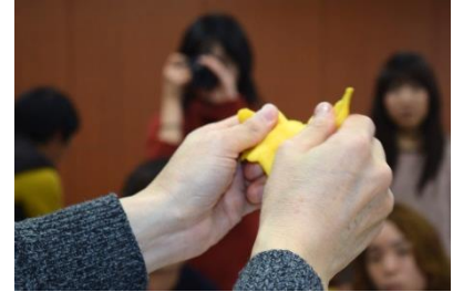
手でこねる（2～3回）空気をいれない