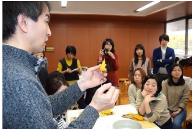
形を作り、竹串を通して、芯をいれる（仕上げにパーナーであぶる）