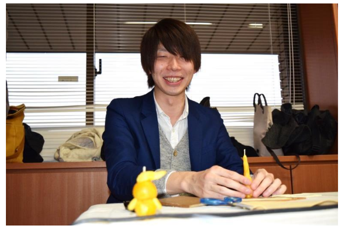
うきぴーと、東京タワー