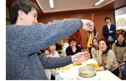
4つの棒で、スパイラル形のろうそくを作る