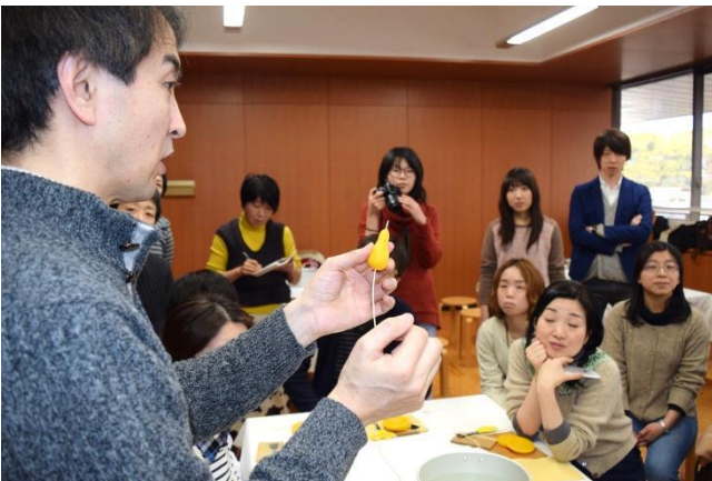
竹串を通して、芯糸をいれる