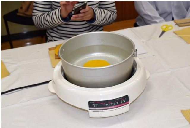
蜜ろうを48度でやわらかくする。