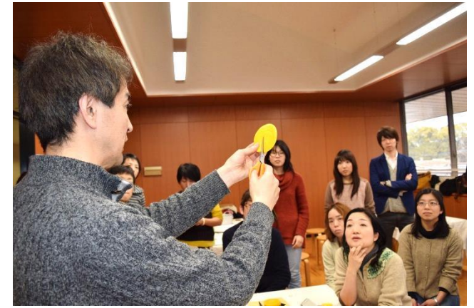
大きさを別に切り分け、手でこねる。