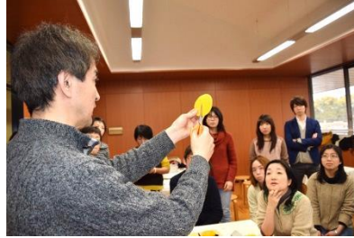
大きさ別に切り分ける